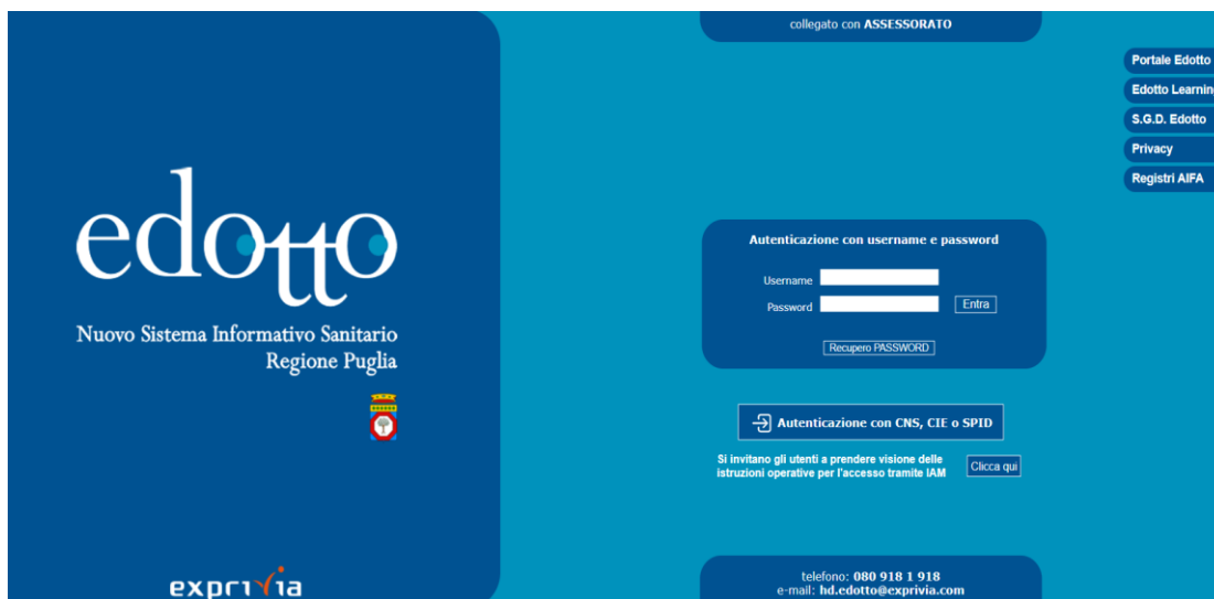
Figura 1: Homepage di accesso Edotto

Le strutture pubbliche e private sono tenute a consultare costantemente la sezione pubblica della piattaforma di gestione documentale del sistema, nonché il portale regionale della salute ( www.sanita.puglia.it ) ed il portale interno del sistema Edotto. In figura 1 è riportata l’homepage di accesso ad Edotto (in alto a sinistra sono presenti i link di accesso alla homepage del portale interno “Portale Edotto” ed al sistema documentale “S.G.D. Edotto”).