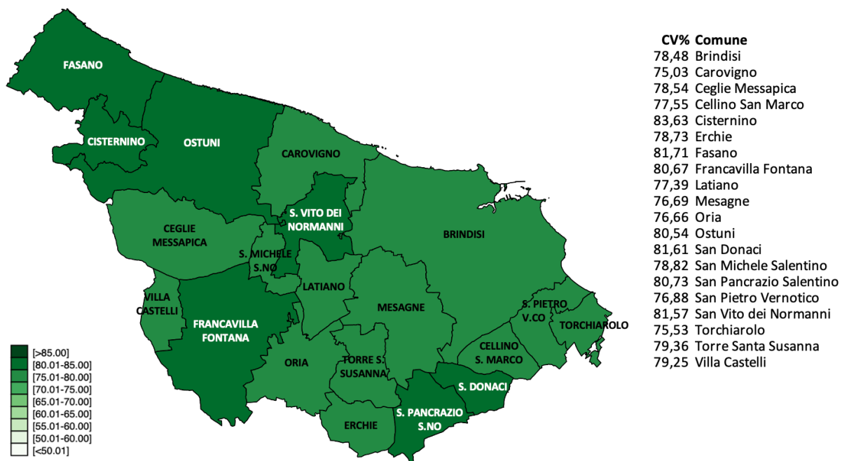
Cartogramma b.1. Copertura vaccinale (ciclo completo), per comune di residenza.