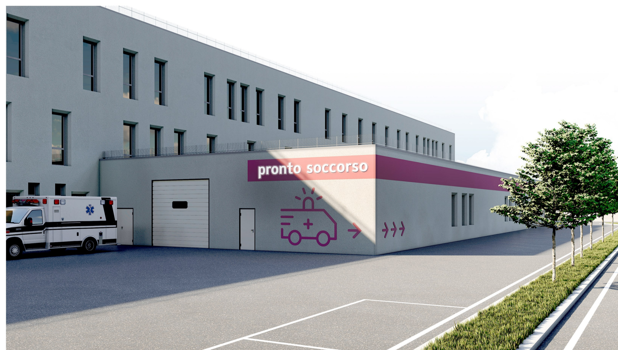
Uscita pronto soccorso