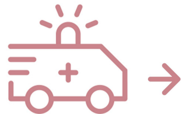
immagine ambulanza su parete (ingombro complessivo L3000x H2800)