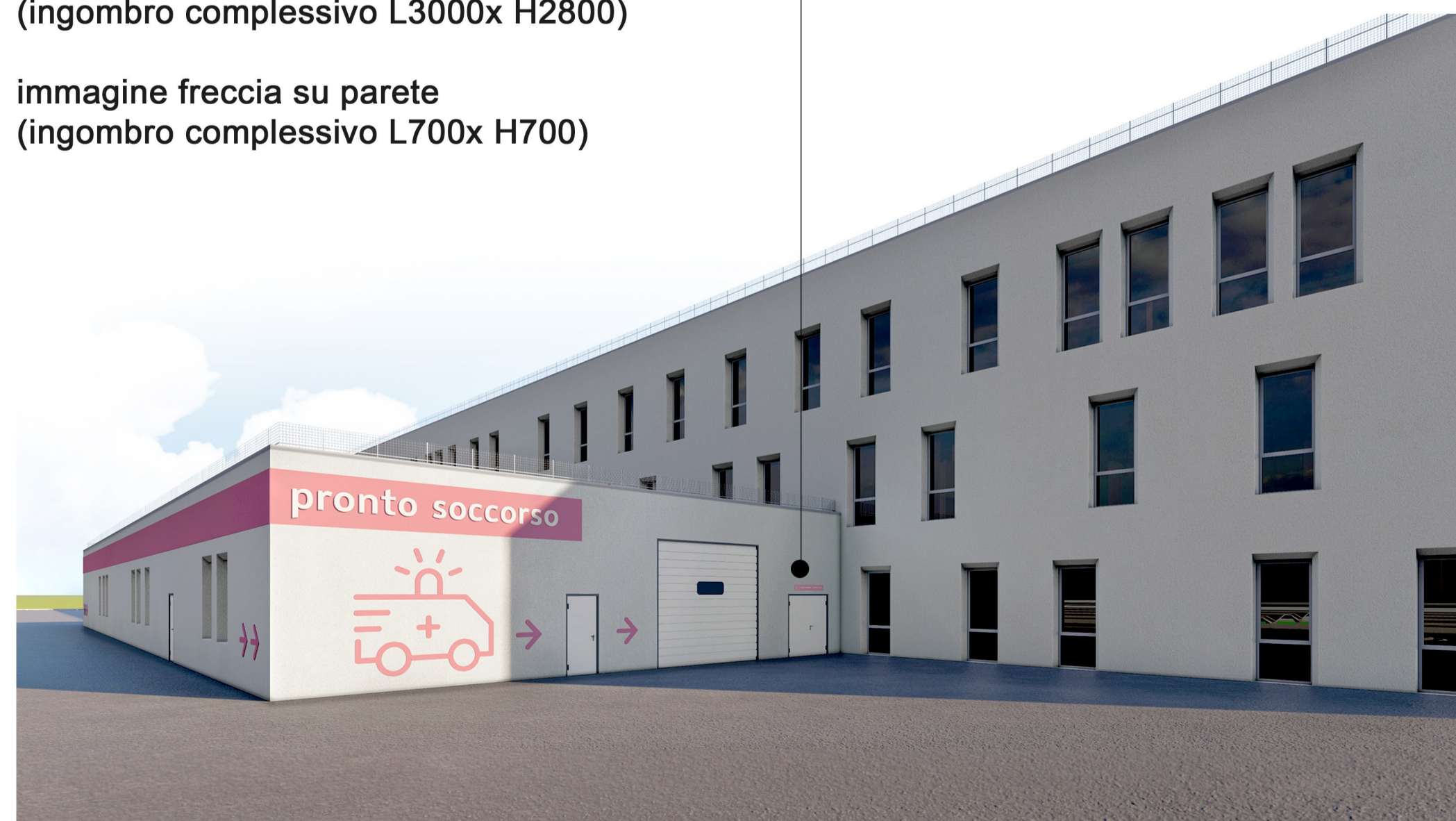
Ingresso pronto soccorso