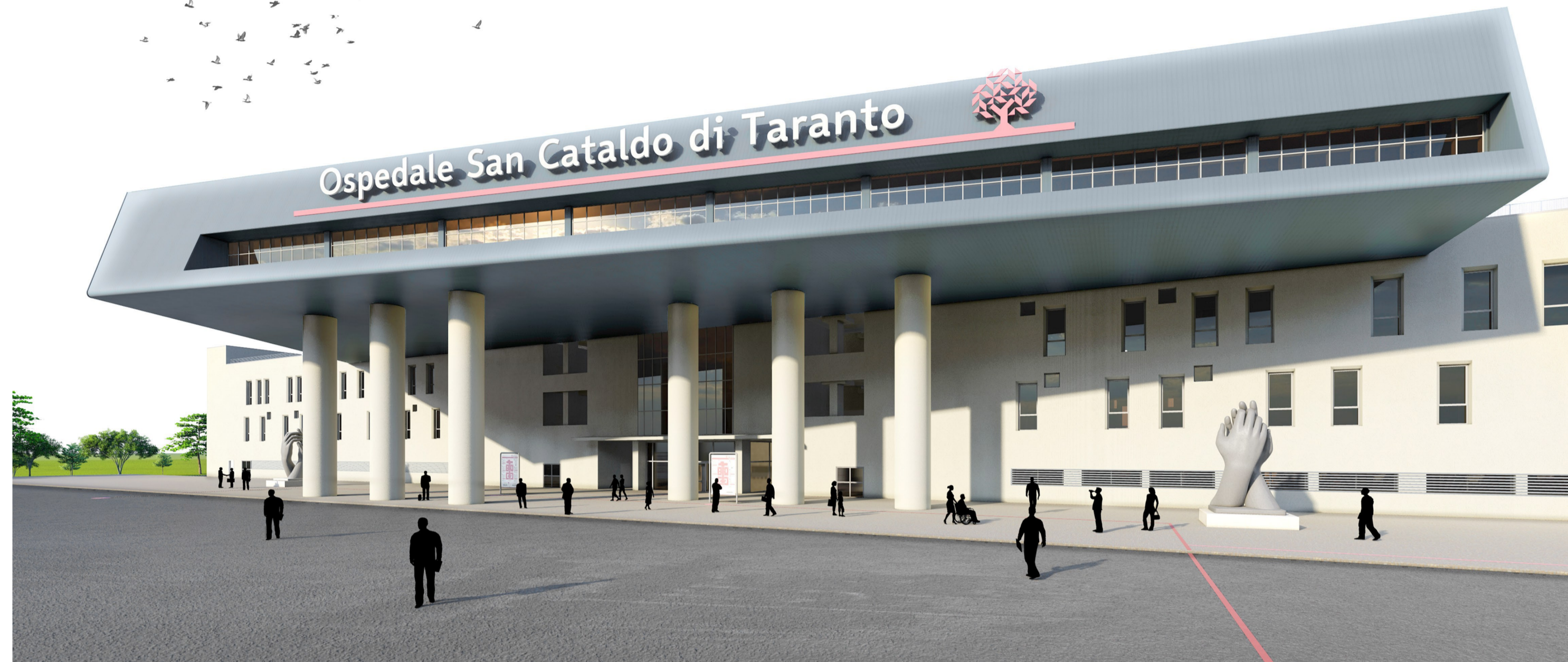
INSEGNA INGRESSO OSPEDALE (ingombro complessivo L43000x H3000)