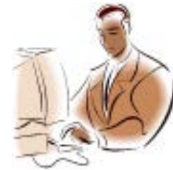
Medici di famiglia