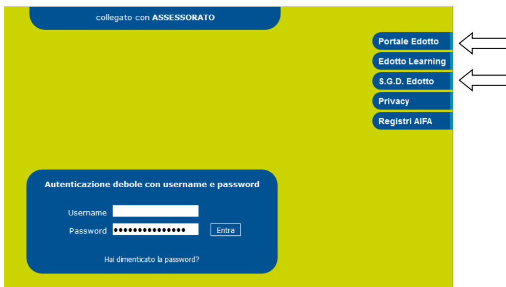
Figura 2. Indicazione dei portali di riferimento Edotto nella homepage di accesso

Le strutture pubbliche e private sono tenute a consultare costantemente la sezione pubblica della piattaforma di gestione documentale del sistema, nonché il portale regionale della salute ( www.sanita.puglia.it ) ed il portale interno del sistema Edotto (in figura 2 sono evidenziati i link di accesso alla homepage al portale interno Edotto ed al sistema documentale).